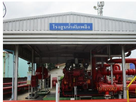
ภาพที่ 2-22 เครื่องสูบน้ำดับเพลิง