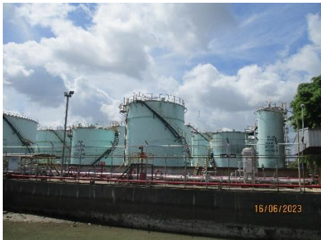
ภาพที่ 2-19 ระบบฉีบน้ำดับเพลิงบริเวณถังเก็บน้ำมัน