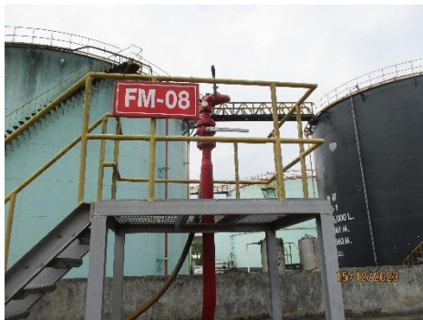
ภาพที่ 2-23 ระบบฉีดน้ำดับเพลิงแบบโฟม