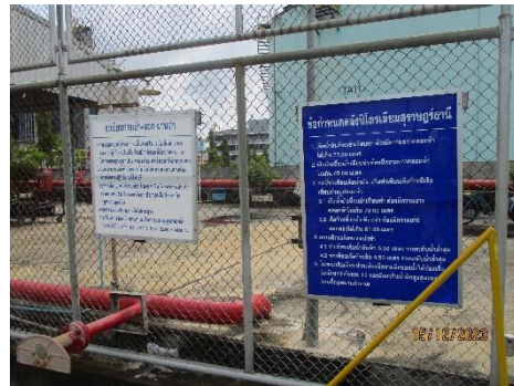
ภาพที่ 2-13 การติดประกาศระเบียบการเข้า-ออก ผ่านท่าบริเวณท่าเทียบเรือ