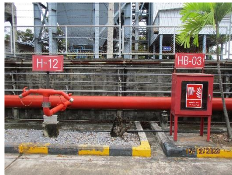
ภาพที่ 2-24 ระบบท่อน้ำดับเพลิง และสายฉีดน้ำดับเพลิง