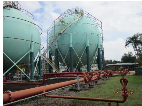
ภาพที่ 2-20 ระบบฉีบน้ำดับเพลิงบริเวณถังเก็บ ก๊าซปิโตรเลียมเหลว