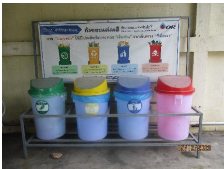
ภาพที่ 2-14 ถังขยะแยกประเภท