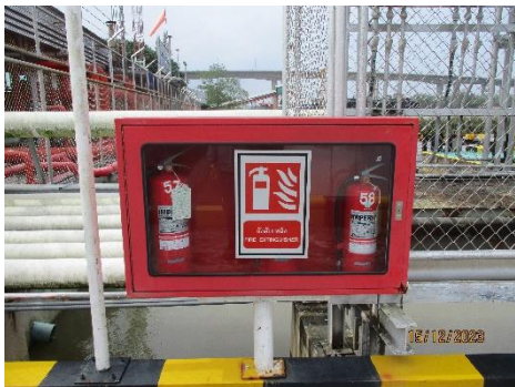
ภาพที่ 2-21 ถังดับเพลิง