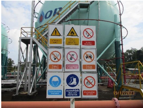
ภาพที่ 2-17 การติดป้ายเตือนสวมใส่อุปกรณ์ป้องกัน อันตรายส่วนบุคคลบริเวณคลังก๊าซธรรมชาติ