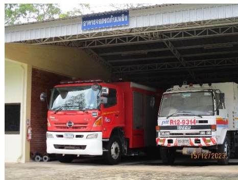
ภาพที่ 2-27 รถดับเพลิงและกู้ภัย