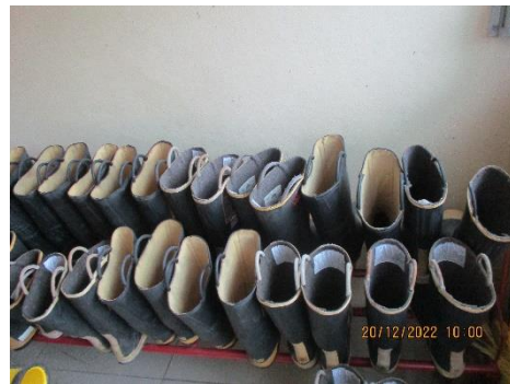
ภาพที่ 2-25 ชุดผจญเพลิงและกู้ภัย