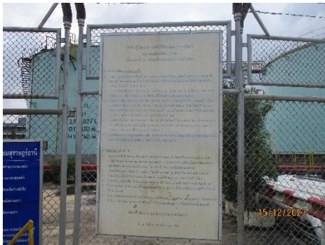
ภาพที่ 2-12 การติดประกาศกฎความปลอดภัยทั่วไป บริเวณท่าเทียบเรือ