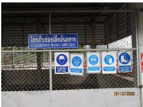
ภาพที่ 2-15 โรงเก็บของเสียอันตราย