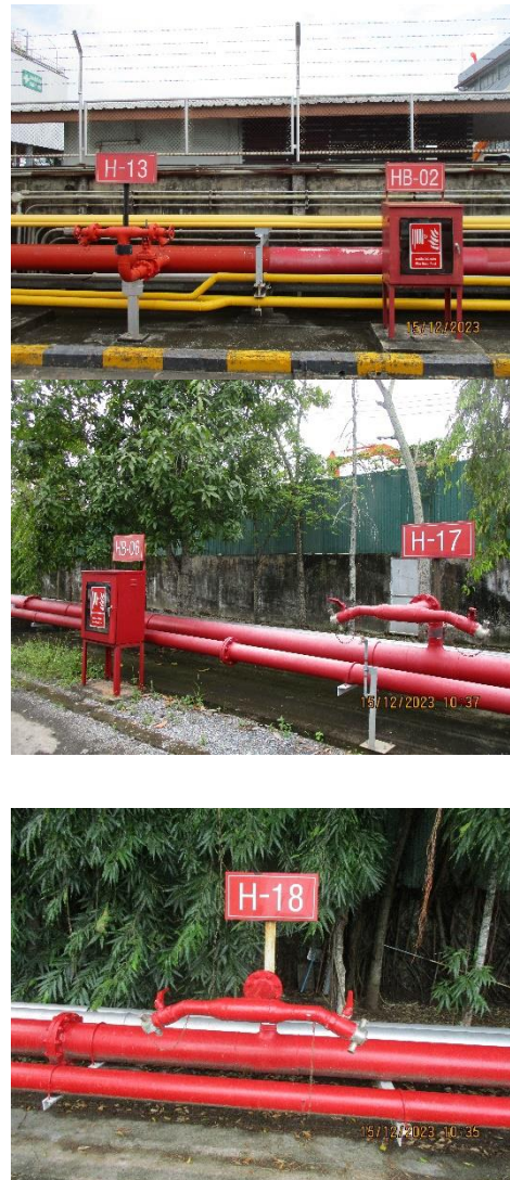
ภาพที่ 2-28 ระบบจ่ายน้ำดับเพลิง