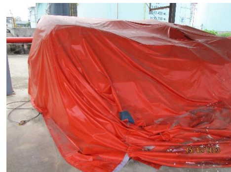
ภาพที่ 2-7 ตัวอย่างอุปกรณ์กำจัดคราบน้ำมัน