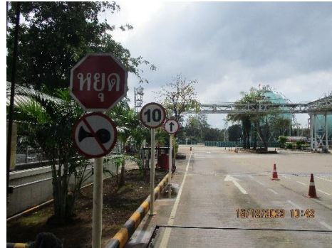
ภาพที่ 2-8 ป้ายเตือนและบังคับจราจรภายในพื้นที่โครงการ