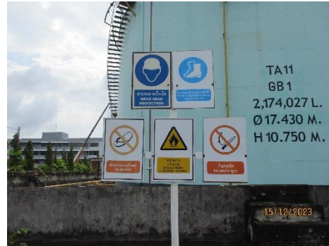
ภาพที่ 2-18 การติดป้ายเตือนสวมใส่อุปกรณ์ป้องกัน อันตรายส่วนบุคคลบริเวณคลังน้ำมัน