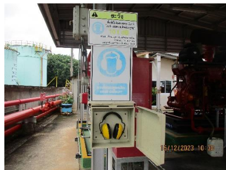
ภาพที่ 2-3 การจัดเตรียมอุปกรณ์ป้องกันอันตราย จากเสียงสำหรับผู้ปฏิบัติงานในพื้นที่ดังกล่าว