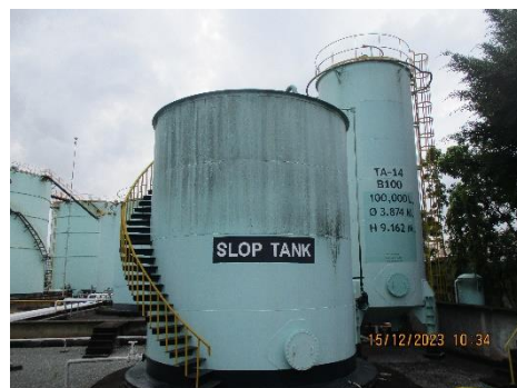
ภาพที่ 2-16 Slop Tank