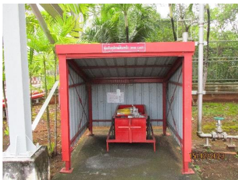
ภาพที่ 2-26 จุดเก็บสารฉีดน้ำดับเพลิง