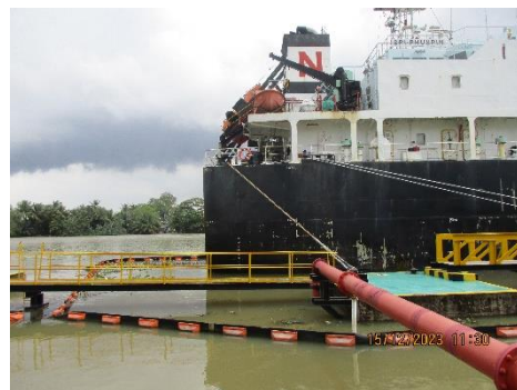
ภาพที่ 2-4 การควบคุมการรั่วไหลของน้ำมันระหว่างการขนถ่าย