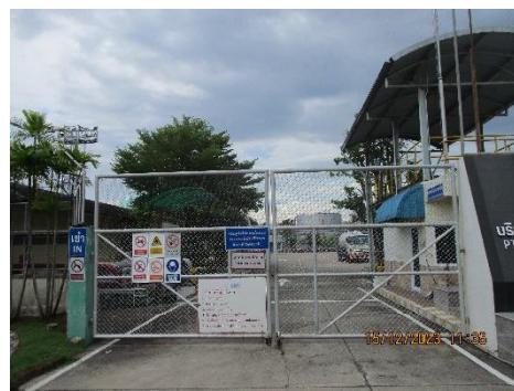
ภาพที่ 2-9 ป้ายเตือนระวางรถเข้า-ออกจากโครงการบริเวณทางเข้าโครงการ