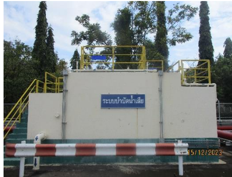
ภาพที่ 2-5 ระบบบำบัดน้ำเสีย