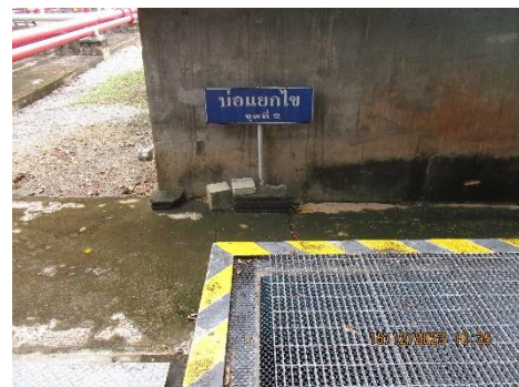
ภาพที่ 2-6 บ่อแยกไขมัน